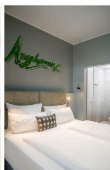
Umgestaltetes Zimmer im KOOS