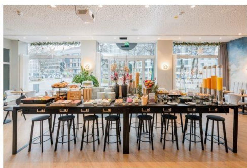
Frühstücksbuffet im KOOS