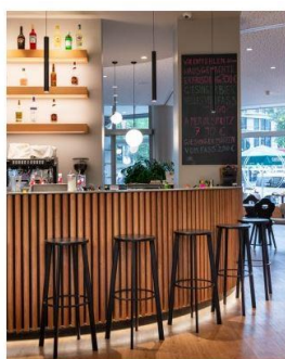
Bar im KOOS